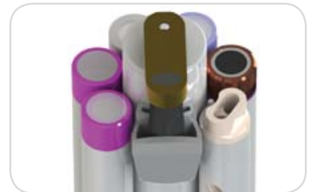
Der Wischer hält die Sensoren frei von Aufwuchs

Batterie-Gehäuse Anschnitt: Druckstabile interne Wabenstruktur