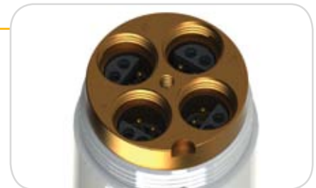
EXO1 Sonde mit 4 universellen Sensoranschlüssen