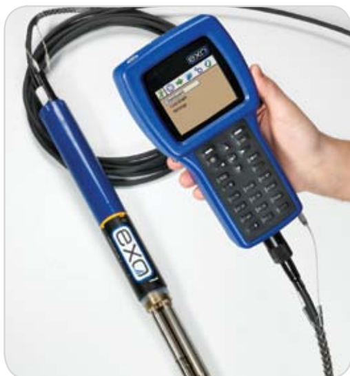
Kommunikation mit der EXO-Sonde unter Verwendung des EXO-Handgeräte-Displays