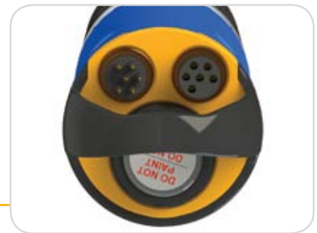
Kabelstecker, Batteriefach und Erweiterungsanschluss an eine weitere Sonde